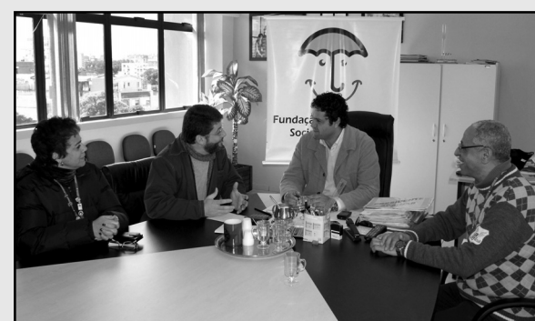
Iniciativa renova relação com produtores locais para aquisição de alimentos

A renovação do convênio com o Ministério de Desenvolvimento Social e Combate à Fome trouxe a Porto Alegre o diretor da Secretaria Nacional de Segurança Alimentar, Marcelo Piccin, que foi recebido ontem, 4, pelo presidente da Fundação de Assistência Social e Cidadania (Fasc). “A experiência positiva do convênio anterior é o aval maior para a renovação do contrato”, disse Piccin. A iniciativa busca estabelecer uma relação com produtores locais para aquisição de alimentos às Cozinhas Comunitárias, Restaurante Popular e programas sociais da Fasc.