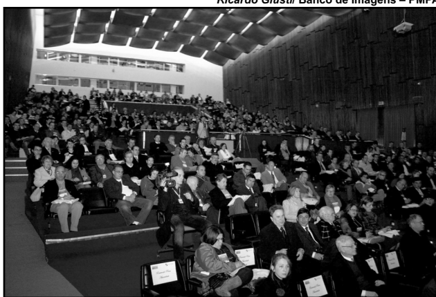
Serão investidos R$ 2,5 bilhões na cidade