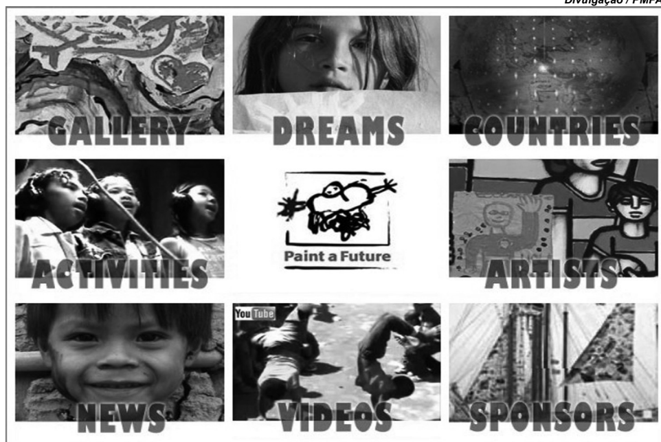
São 120 telas pintadas por artistas de 40 nacionalidades

São 120 telas pintadas por artistas de 40 nacionalidades a partir do imaginário de crianças pobres de países como Bulgária, Bósnia, Brasil, Argentina, Chile e Peru. O projeto Paint a Future abre amanhã, na Usina do Gasômetro.