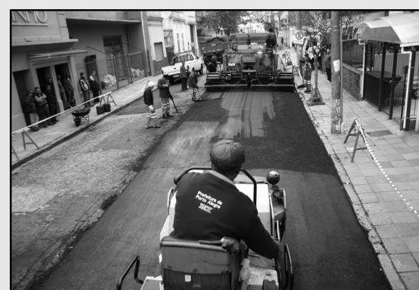
Rua Ernesto Alves ganha novo asfalto

A Secretaria de Obras e Viação (Smov) concluiu hoje o capeamento asfáltico da rua Ernesto Alves, entre a Farrapos e a Voluntários da Pátria. A via será um dos desvios de trânsito necessários ao início da recuperação estrutural do Túnel da Conceição. São 185 metros de comprimento, que recebem cerca de 180 toneladas de asfalto revitalizado. O objetivo é oferecer mais uma alternativa a táxis e outros veículos saídos da rodoviária, para a travessia da cidade pelas avenidas Cristóvão Colombo e Osvaldo Aranha.