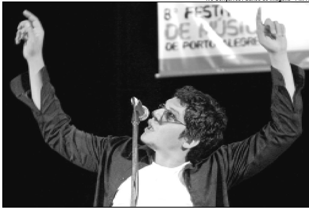
Classificados irão participar da gravação de um CD duplo