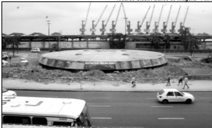
Obras vão modernizar a Estação Mercado e reurbanizar a Praça