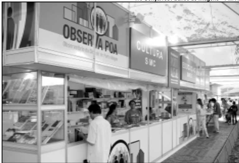
Observatório reúne dados, reflexões e análises sobre 82 bairros e 16 regiões