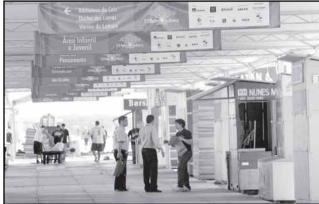
Cais do Porto é um dos locais a serem visitados por crianças e adultos

A Prefeitura está mobilizada para garantir o bom funcionamento da 55ª Feira do Livro. Aspectos como limpeza, inclusão, segurança e tecnologia envolverão equipes de servidores do início ao final do evento, de 30 de outubro a 15 de novembro.