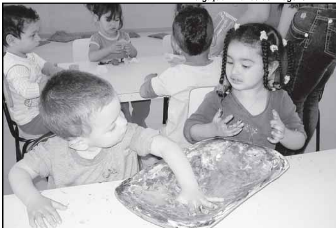
Dois escolas municipais têm trabalhos expostos na Bienal do Mercosul