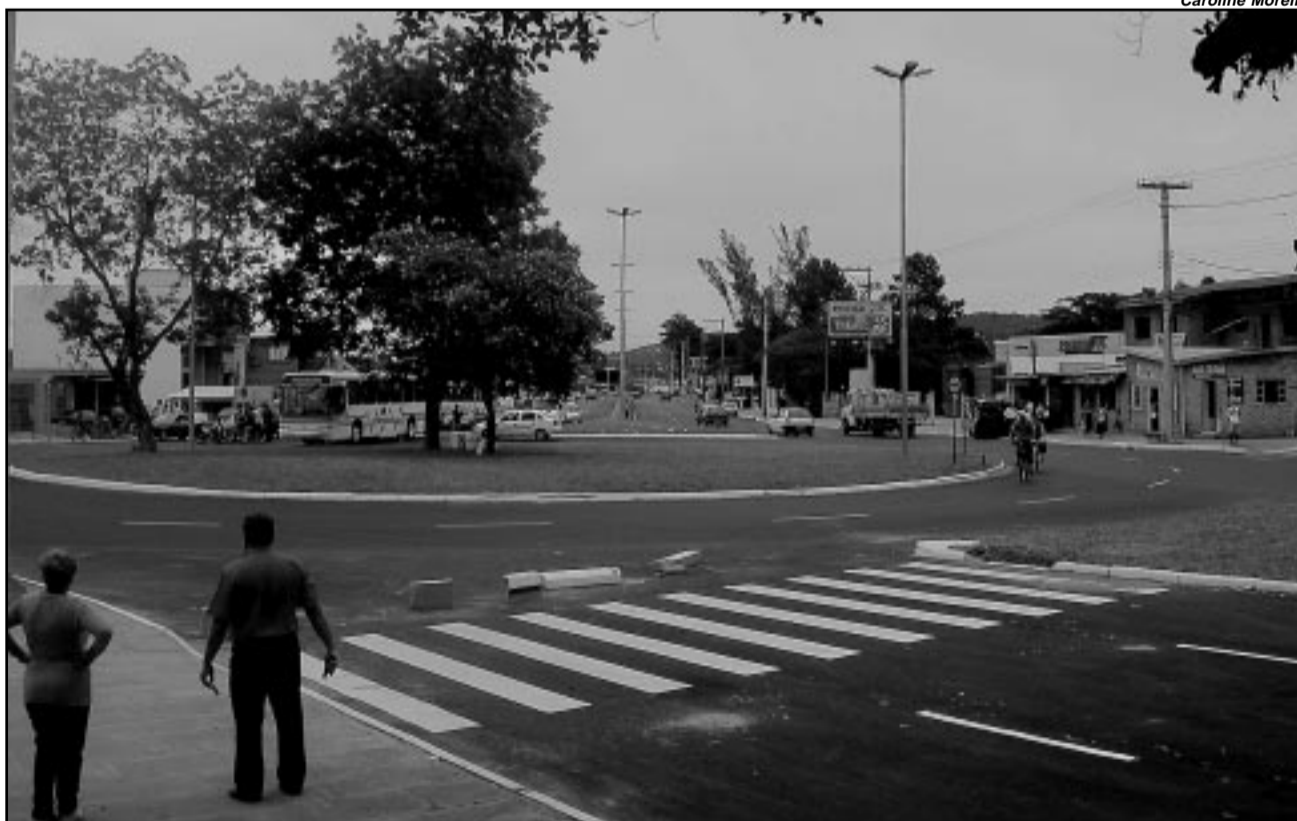
Duplicação da Avenida Juca Batista é uma das obras decididas pela população no OP

O OP de Porto Alegre foi indicado pela ONU seguidas vezes como uma das práticas públicas mais inovadoras para a garantia da transparência. A partir deste modelo, Porto Alegre projetou-se internacionalmente. A cada ano, cerca de 150 cidades de vários países reproduzem o método utilizado pela capital gaúcha. O próprio Fórum Social Mundial foi realizado em Porto Alegre em função dos canais de participação popular existentes na cidade. Aos poucos, centenas de outros municípios também passaram a utilizar o modelo como referência.