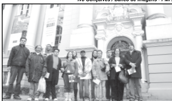
Pacientes fizeram visita ao Museu de Artes do Rio Grande do Sul (Margs)