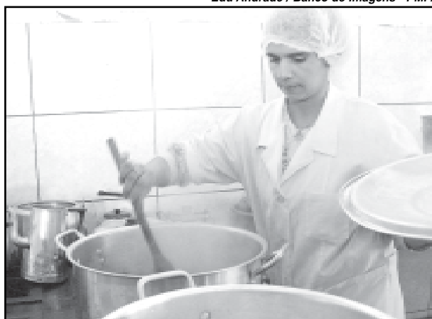
Usuários de nove cozinhas comunitárias também serão beneficiados

Pesquisas - A inclusão dessas populações específicas no programa de Segurança Alimentar é uma das ações resultantes da análise das pesquisas encomendadas pela Fundação de Assistência Social e Cidadania (Fasc) para a Ufrgs. Os estudos apontaram a existência de 1203 adultos e 383 crianças e adolescentes em situação de rua, e uma população de 633 pessoas que se reconhecem descendentes de escravos refugiados, distribuídas em 171 famílias, em quatro quilombos. No estudo com a população afro-brasileira moradora nos bairros de maior