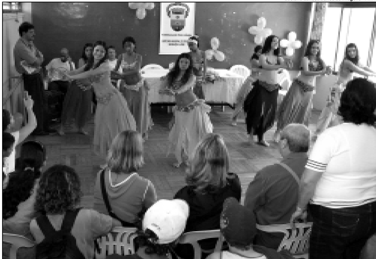
Projeto terá atividades artísticas e esportivas