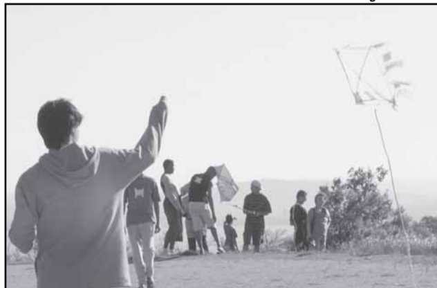
Entre as atrações, o 10º Festival de Pandorgas, no Parque Natural Morro do Osso