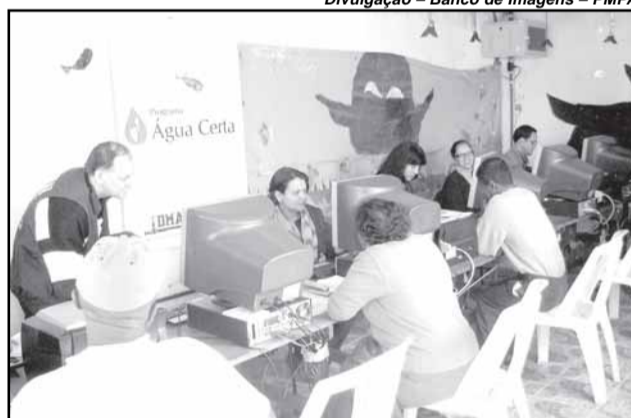
Em três anos, foram realizados mais de 70 mutirões

Aprovada pela Câmara Municipal em 6 de fevereiro de 2008, a lei 10.378 instituiu a Semana Municipal do Hip-Hop, que integra o calendário de eventos da cidade.