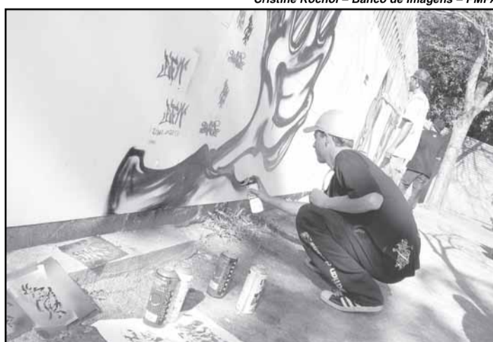
Grafiteiros também participam da 1ª Semana Municipal do Hip Hop

Nas batalhas de B.boys e Freestyle estão confirmadas as participações de 16 duplas e shows de Restinga Crews, Street Boys e West Crews são de Porto Alegre. Representantes de Bento Gonçalves, São Leopoldo, Novo Hamburgo, Caxias do Sul e Pelotas também estarão na disputa. Haverá ainda shows com os Grupos Nego Prego, Juice, W. Negro, Manos da Periferia e Revolução RS.