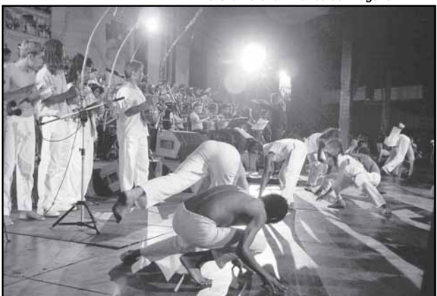
O espetáculo reuniu 300 alunos de nove escolas municipais