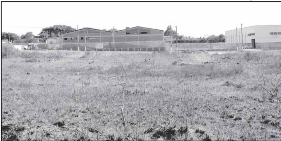
Terreno com 78 mil metros quadrados será cercado pela Smed