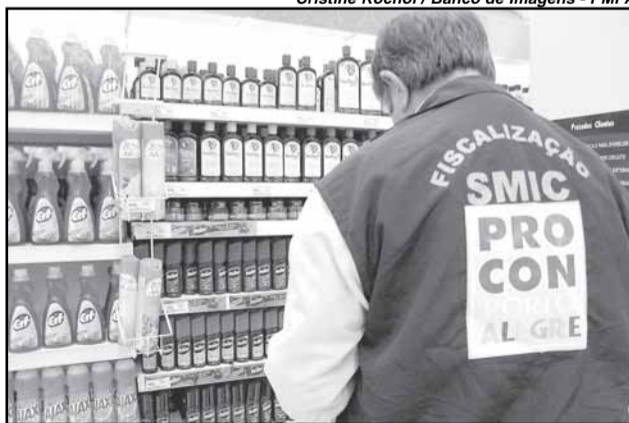
Fiscais do Procon estiveram em mais de 5 mil estabelecimentos