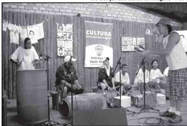
Ano assado, mais de 90 oficinas foram ministradas