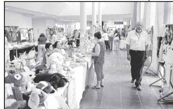
Feira de Natal

Textos elaborados e de responsabilidade da Assessoria de Comunicação da Câmara