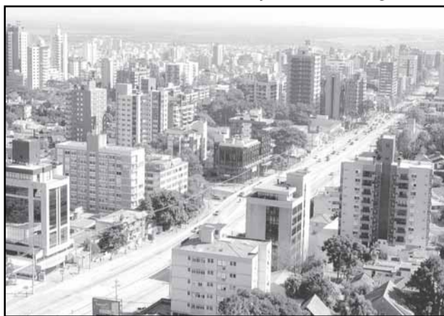
49% das 518.795 guias emitidas foram quitadas

Seleção - A pré-seleção será realizada dia 6 de fevereiro, com