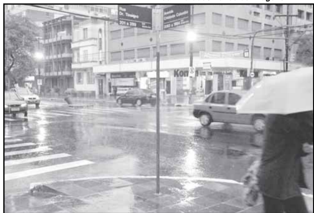
Conduto Álvaro-Chaves resolveu o problema dos alagamentos no Goethe