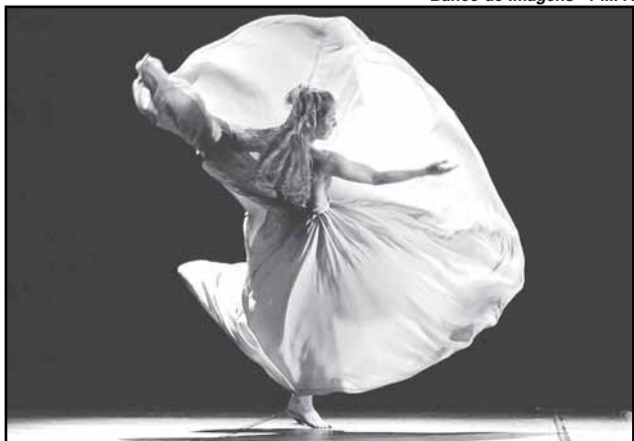
Serão apresentadas mais de 40 coreografias

partir de hoje, 7, a 15ª edição da tradicional Mostra de Dança Verão, que abre o circuito cultural do ano.