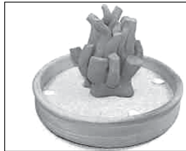
Rolos de barro repetem-se nas obras