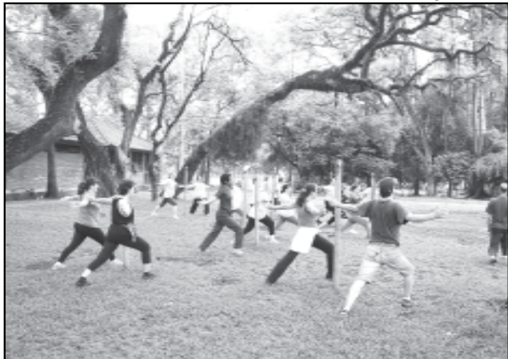
O Parque Ramiro Souto promove aulas abertas durante a semana