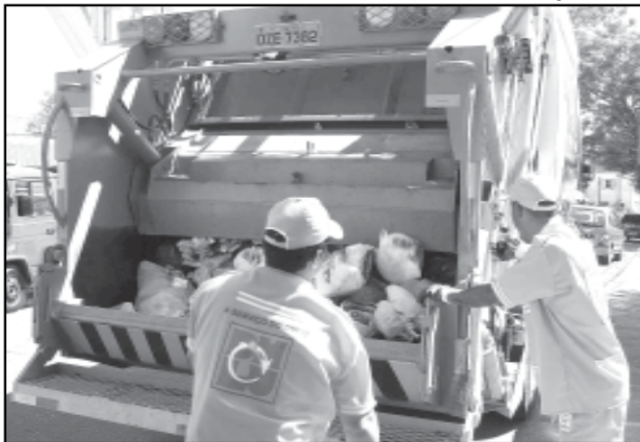
O visual da frota e o uniforme dos profissionais também são elogiados pelos porto-alegrenses