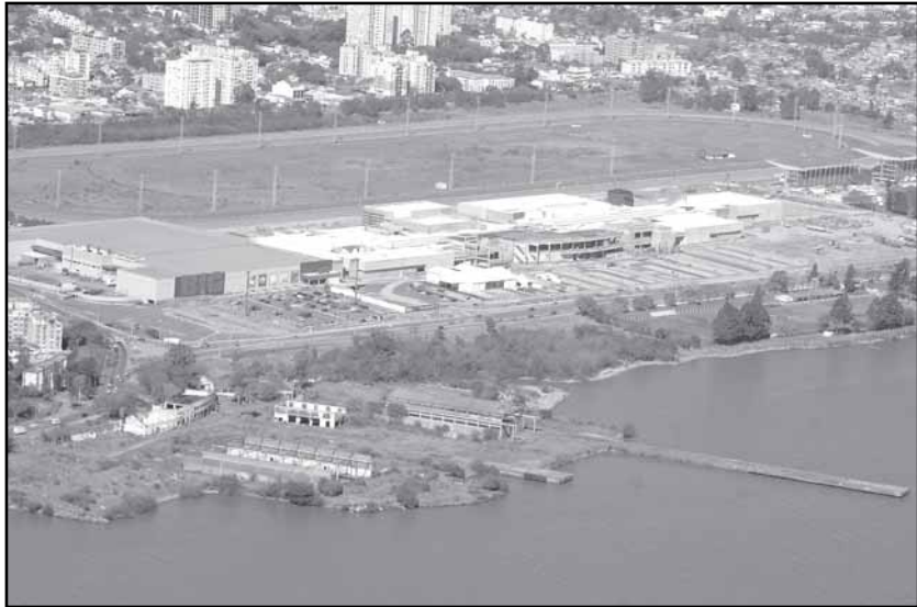
Caberá à população, por meio do voto direto, a definição do uso da área

M ais uma vez Porto Alegre é pioneira no país na realização de uma consulta universal que decidirá sobre a área urbanística da cidade. Neste próximo domingo, das 9h às 17h, ocorrerá a consulta pública para definir o futuro da antiga área do Estaleiro Só, na Orla do Guaíba.