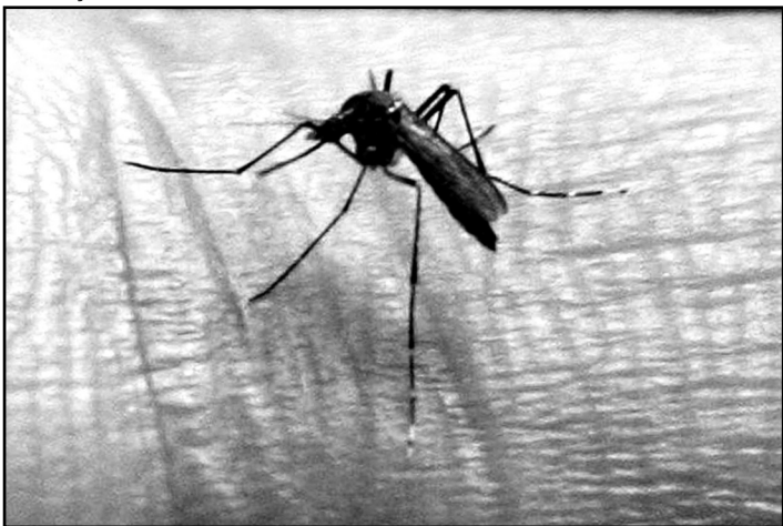
Mosquito da Dengue, Aedes aegypti