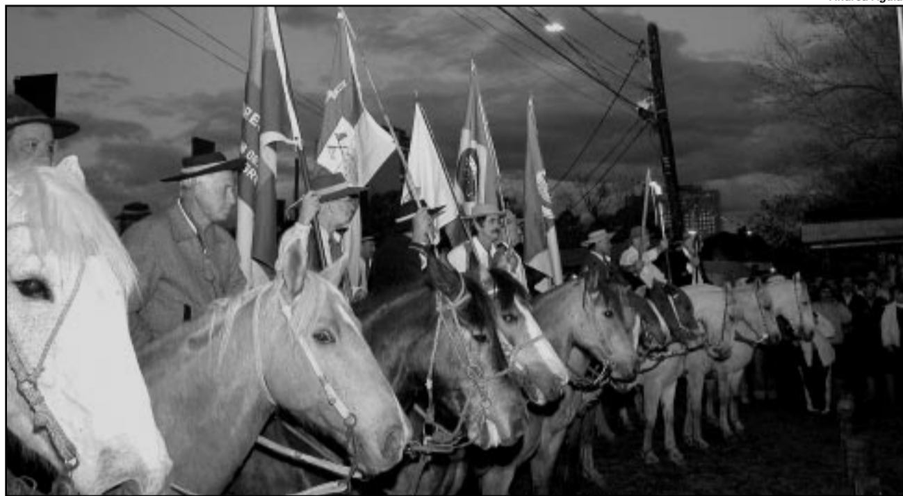
Festejos se realizam no Parque Maurício Sirotsky Sobrinho, de 1.º a 20 de setembro