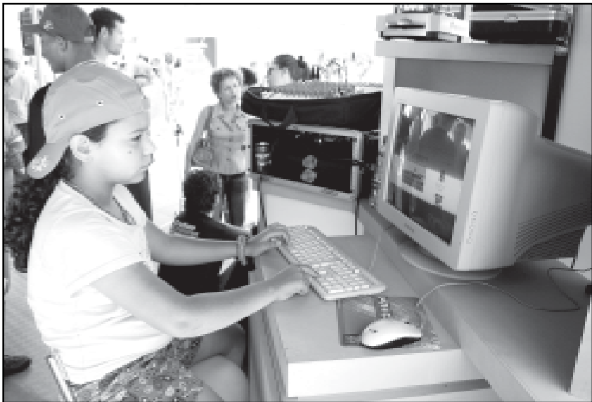
Tecnologia disponibiliza Internet sem fio no Mercado Público, parques e praças