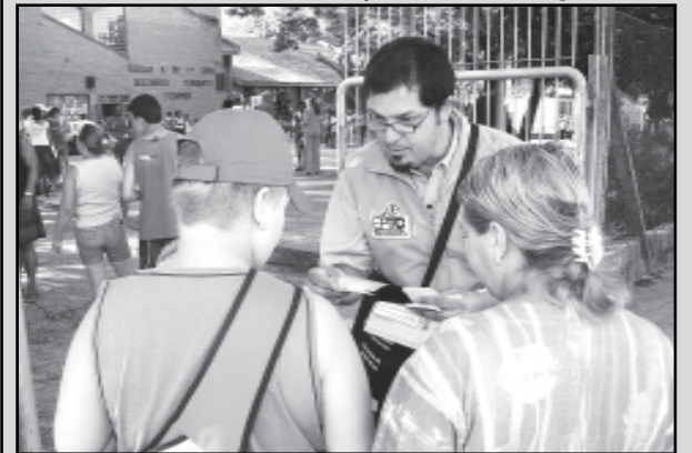
Agentes vão distribuir folders de conscientização para trânsito seguro