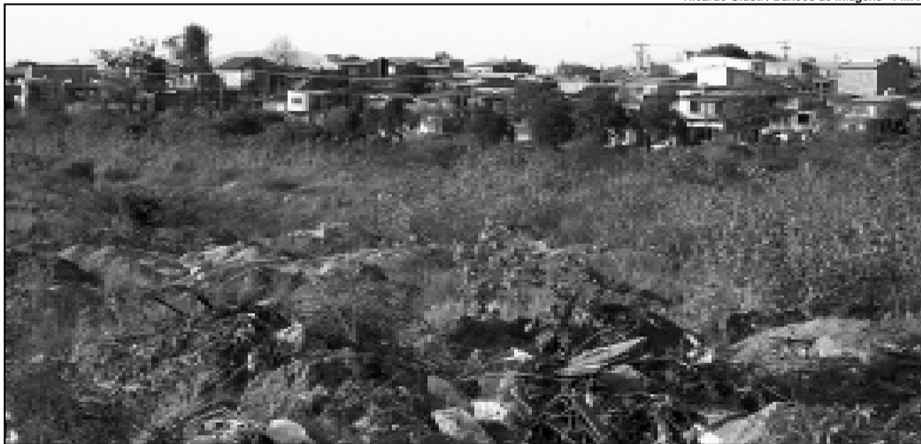
Demhab trabalha no projeto das unidades habitacionais que serão construídas no local