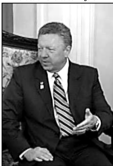
Ronald Atkinson, presidente da ASQ

A equipe da Fasc realizou um mapeamento preliminar da situação nessas áreas e verificou que, na maioria das vezes, as menores são trazidas em carros por homens que depois circulam na região, fazendo o monitoramento. A presença de crianças e adolescentes é constante nesses pontos, com tendência de crescimento.