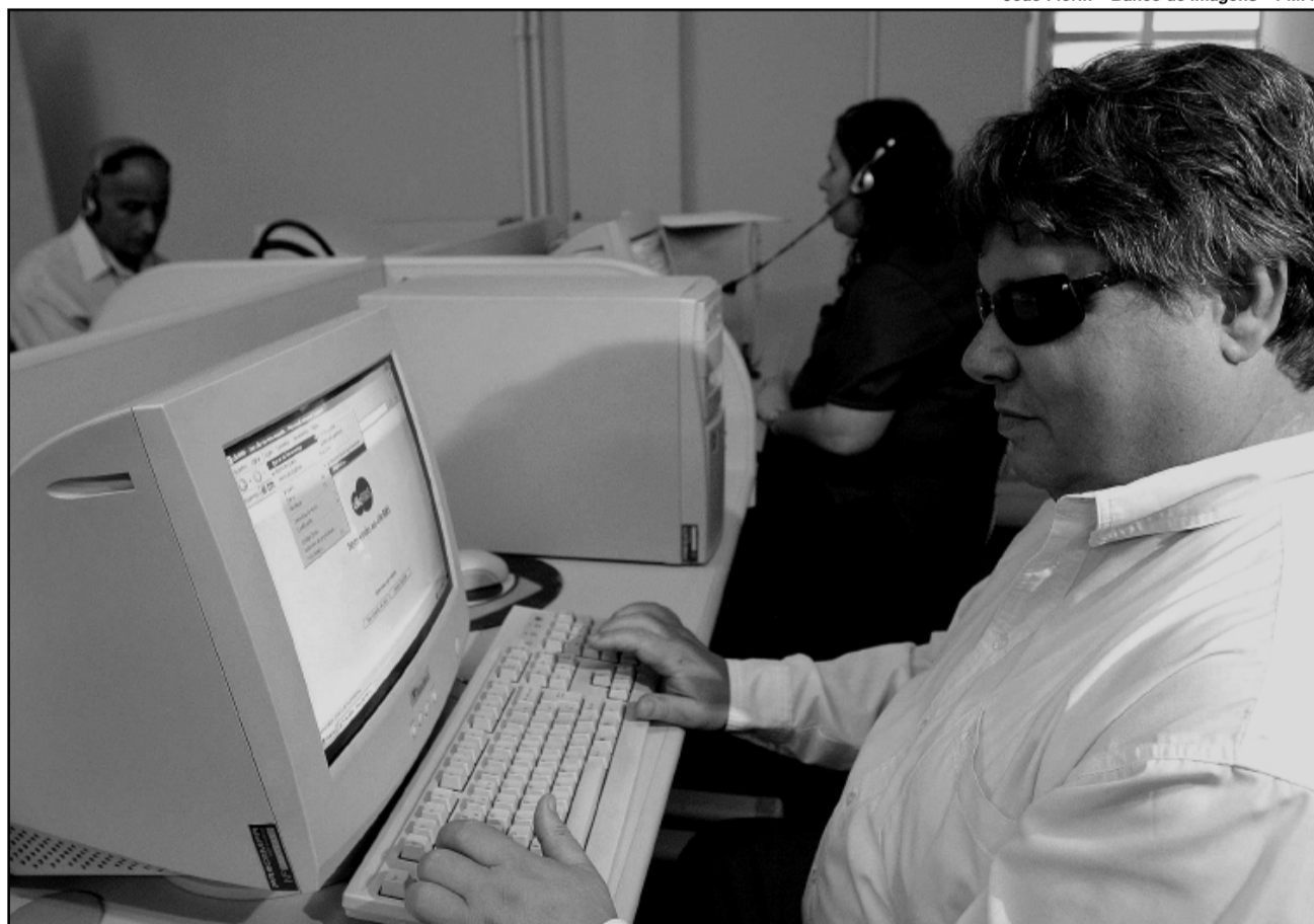
O programa Virtual Vision lê a tela para o deficiente visual