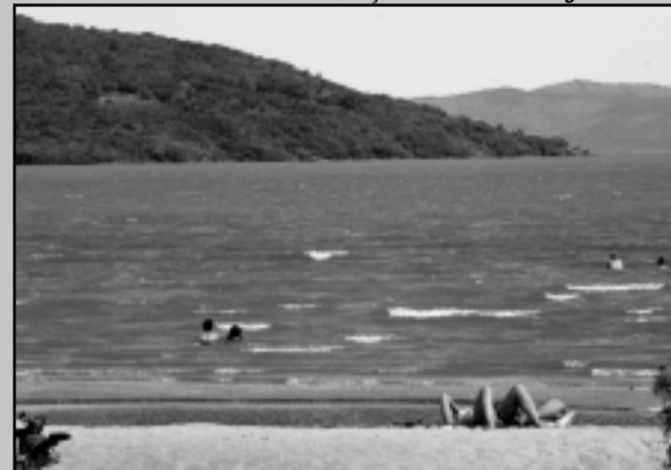
O objetivo é mostrar a importância da preservação daquela área

A partir deste sábado e domingo, dias 7 e 8, o Comitê Gestor de Educação Ambiental da Prefeitura, coordenado pela Secretaria Municipal do Meio Ambiente (Smam), inicia trabalho de educação ambiental nas praias do Lami e de Belém Novo.