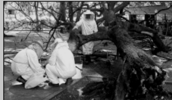
Os favos de mel e parte do ninho foram colocados numa caixa apícola

Para retirar um enxame de abelhas de uma árvore que tomou no último temporal, na Praça XV de Novembro, a Secretaria Municipal do Meio Ambiente (Smam) realizou hoje uma operação coordenada pela Zonal Centro. O tronco teve de ser cortado aos pedaços, depois foram retirados os favos de mel e parte do ninho, colocados em seguida numa caixa apícola instalada sobre a árvore para atrair o enxame completo. O enxame foi levado no final da tarde e a árvore será removida amanhã.