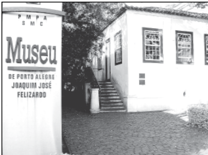
O Museu de Porto Alegre foi criado em 1979