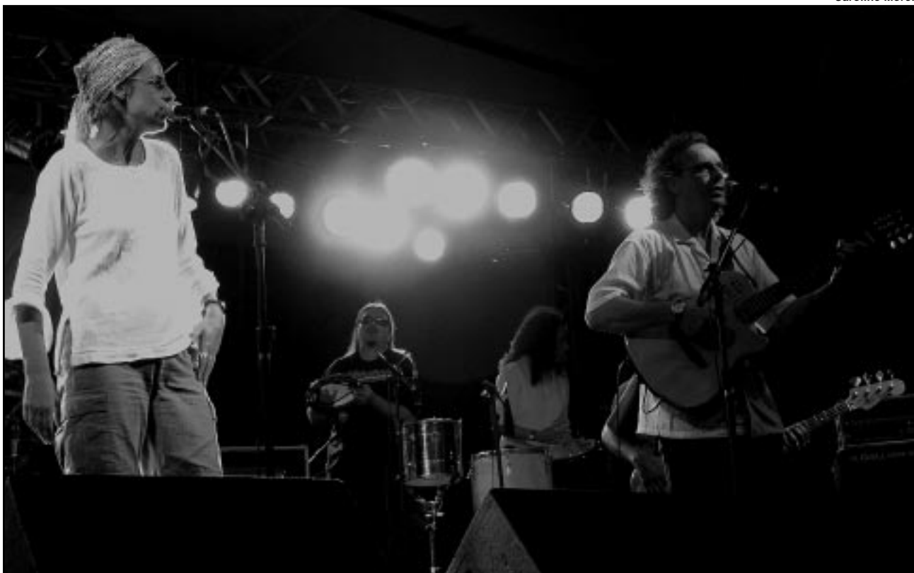
Músicos gaúchos disputam primazia de legar uma canção a Porto Alegre