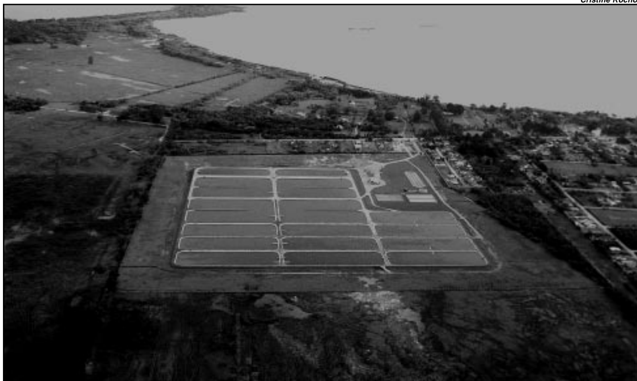
Meta é ampliar dos atuais 27% para 77% o índice de tratamento de esgotos na cidade