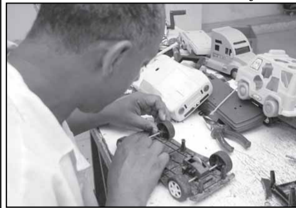
Mais de 100 mil brinquedos já foram recuperados