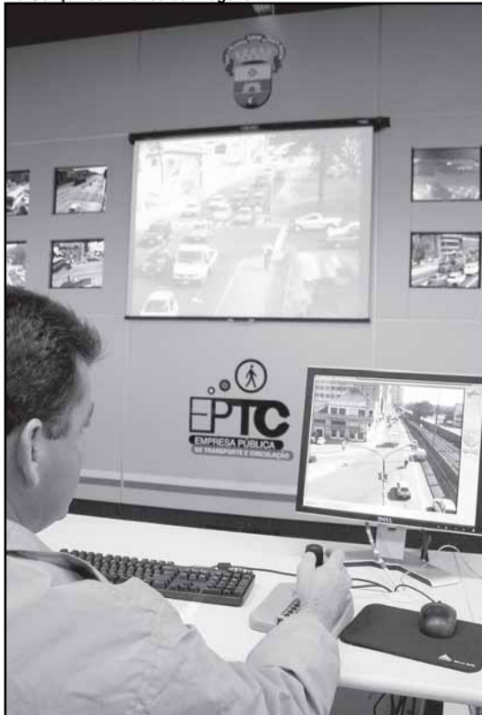
As informações são geradas pelos agentes de trânsito e pela Central de Monitoramento da EPTC

Desde ontem, os internautas já podem acessar informações da Empresa Pública de Transporte e Circulação (EPTC) no Twitter. O microblog www.twitter.com/eptc_poa , que também pode ser acessado pelo celular, publicará, em tempo real, informações de trânsito da Capital.