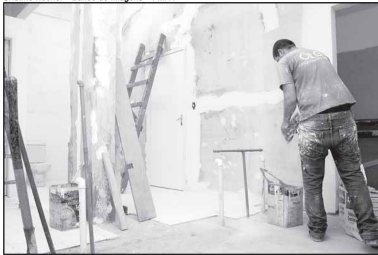
Desde 2007 foram reformadas 110 unidades de saúde