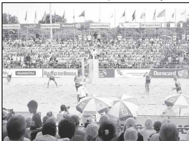
Em março de 2007, Capital sediou a final do circuito, etapa gaúcha

Podem participar duplas em que ambos os atletas têm que estar inscritos em alguma das dez federações participantes. As vagas são limitadas em oito duplas (quatro masculinas e quatro femininas) no torneio principal e outras oito (quatro masculinas e quatro femininas) no qualifying. As inscrições podem ser feitas no site da CBV (www.cbv.com.br) para o Torneio Principal, até as 18h do dia 11. Os congressos técnicos serão dias 17 (qualifying) e 18 (principal), às 19h, na sede da SME na avenida Érico Veríssimo.