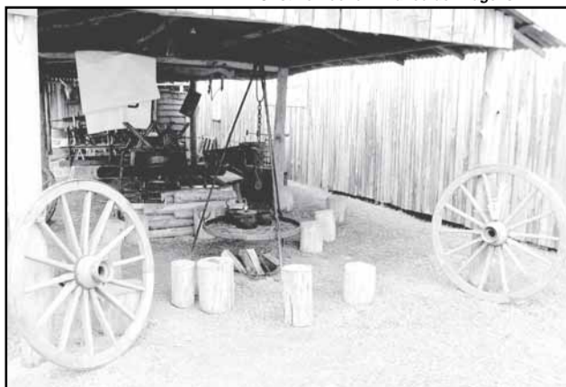
Piquete dos Beijudos é um dos que serão visitados no roteiro