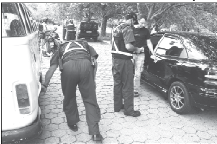
Foram realizadas 48 operações para um trânsito mais seguro, com 4.970 veículos vistoriados

As ações constataram irregularidades em 3.089 carros e 1.881 motos. Houve 828 autuações de condutores, sendo 506 motoristas e 322 motociclistas. Os agentes recolheram 126 veículos por excesso de velocidade, documentação irre-