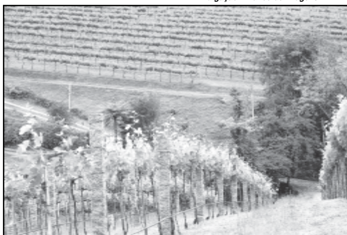
O Roteiro agrega 41 atrativos e uma diversidade de serviços e lazer

O roteiro Caminhos Rurais de Porto Alegre será discutido em palestra hoje, às 8h30, no prédio 50 da Pontifícia Universidade Católica do Rio Grande do Sul (PUCRS). Com o tema Desenvolvimento Sustentável e o Turismo, a coordenadora de Planejamento da Secretaria Municipal de Turismo (SMTur), apresentará aos alunos do curso de Empreendedorismo e Sucessão da universidade um painel sobre a estruturação dos Caminhos Rurais dentro dos conceitos de sustentabilidade, além de divulgar o roteiro, que foi lançado no final de novembro de 2005, em parceria com a Emater-RS e apoio do Senar-RS e que agrega 41 atrativos em propriedades, aliando à atividade agrícola uma diversidade de serviços e lazer.