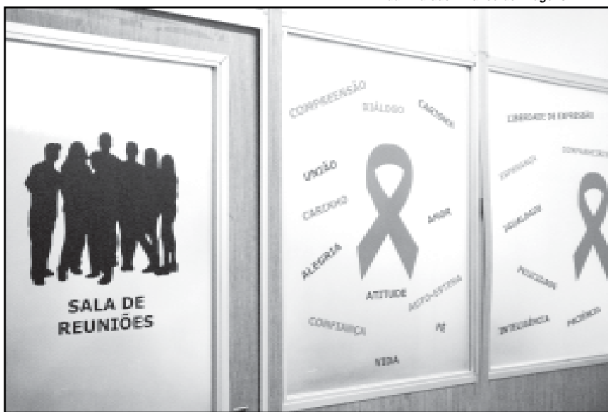
O novo serviço será inaugurado sexta-feira, às 9h30

Cruzeiro — O Centro Municipal de DST/ Aids/ HTLV do Centro de Saúde Vila dos Comerciantes completa 12 anos de existência em maio com 10 mil paci-