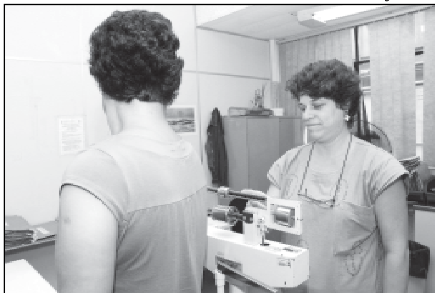
O Projeto Nascer atende cerca de 100 gestantes por ano

O projeto fornece teste rápido de HIV para as maternidades de Porto Alegre e para as mães que não fizeram o teste em um período de três meses.