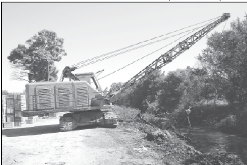
A estimativa é de retirar 108 mil toneladas de material em cinco meses

A prefeitura investe R$ 1,4 milhão no contrato de operação, manutenção e transporte de material retirado da