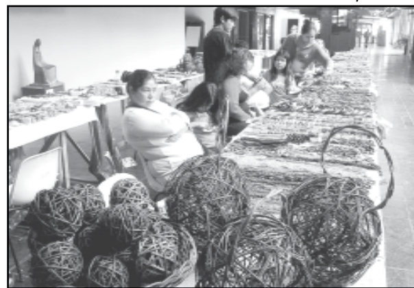
Exposição de artesanato no saguão da CMPA

Textos elaborados e de responsabilidade da Assessoria de Comunicação da Câmara