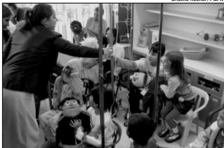
A diversão melhora o humor e fortalece...

O Hospital Santo Antônio e o Dmae pretendem agora firmar uma parceria para garantir atividades periódicas de educação ambiental inseridas no projeto Criar , que funciona há pouco mais de dois anos no Complexo Hospitalar Santa Casa.