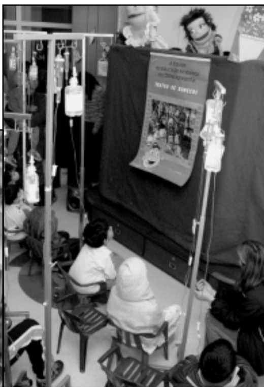
...o sistema imunológico dos pacientes