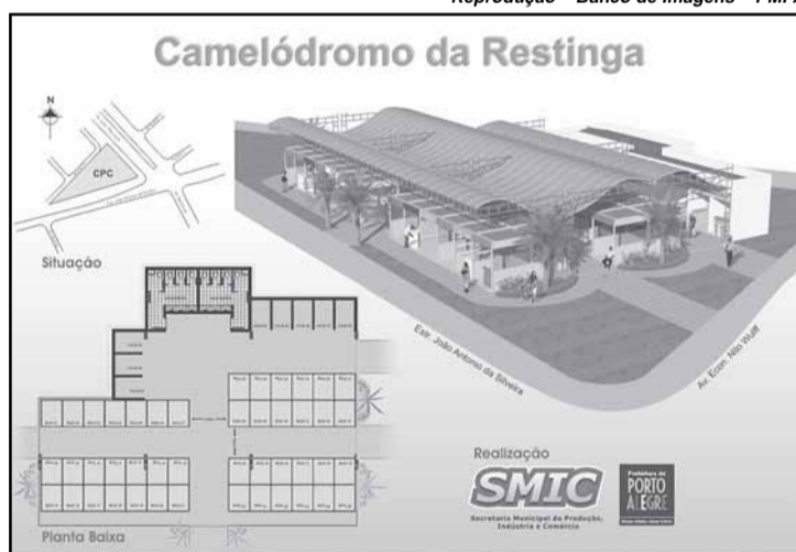
O Camelódromo da Restinga terá 45 lojas de comerciantes populares, três de Frutas e mais cinco de alimentação