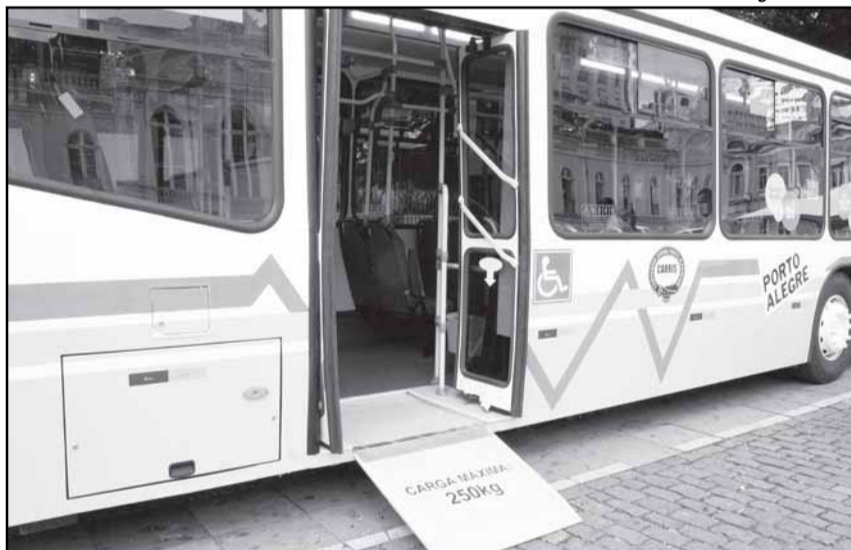
Porto Alegre tem 470 ônibus adaptados para portadores de necessidades especiais

Porto Alegre tem 1.597 veículos em sua frota de ônibus, sendo 470 adaptados para portadores de necessidades especiais. Desde 2009, todos os novos veículos que entraram na frota já são adaptados. Para a advogada Andréa Pontes, cadeirante, entrevistada pela reportagem do Fantástico, o serviço prestado é de