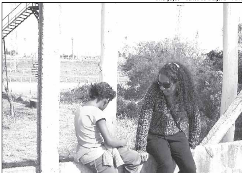
Orientadora do Projeto Ação Rua conversa com menina

Além disso, a rede conveniada de abrigagem a essas crianças e adolescentes está preparada para atender a demanda da Capital. Com a implantação das Casas Lares e dos Abrigos Residenciais, a estrutura deu subsídios para que o projeto tivesse repercussão e se tornasse uma realidade reconhecida.