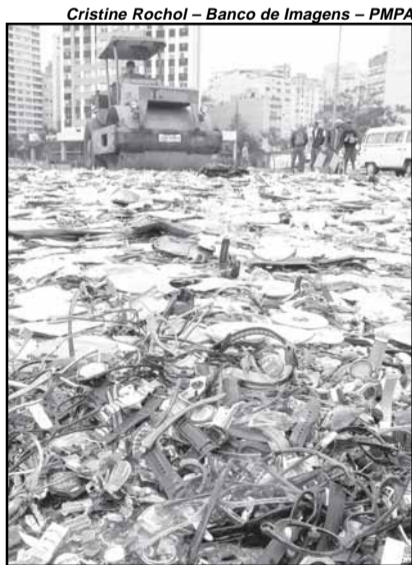
Peças de vestuários e calçados foram doadas para entidades e os itens pirateados foram destruídos publicamente

De 1999 a 2004, 1.580.578 itens irregulares foram apreendidos, como resultado de 14.031 operações de fiscalização. A pirataria de CDs lidera as ocorrências, com mais de 158 mil produtos recolhidos. Em seguida, as apreensões de óculos de sol, que chegaram a mais de 41 mil no período. Além disso, 18 mil brinquedos comercializados sem licença, 23 mil relógios e mais de 7 mil pares de tênis foram retirados de situação irregular e encaminhados ao depósito da secretaria. Também constam na lista mais de 17 mil acessórios diversos, como preservativos e armações para barracas. A