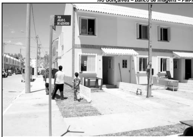
Programa prevê o parcelamento das prestações atrasadas e a mudança de plano

O Programa de Recuperação de Créditos Imobiliários Oriundos de Recursos Próprios, aplicável aos contratos de compra e venda, às concessões de direito real de uso e às per-