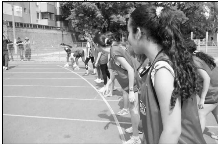
Jogos deste ano devem superar os 2,5 mil participantes do ano passado