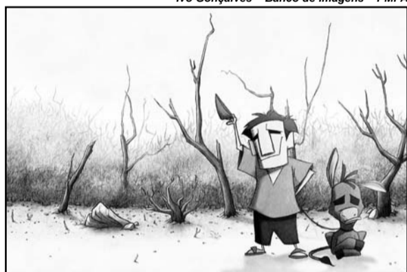
A animação Josué e o Pé de Macaxeira transporta para o interior do Brasil a clássica história João e o Pé de Feijão

Josué e o Pé de Macaxeira é uma história de animação que transporta para o interior do Brasil a clássica história João e o Pé de Feijão, dos Irmãos Grimm. O filme participou de vários festivais, entre eles o Festival de Gramado, conquistando vários prêmios.