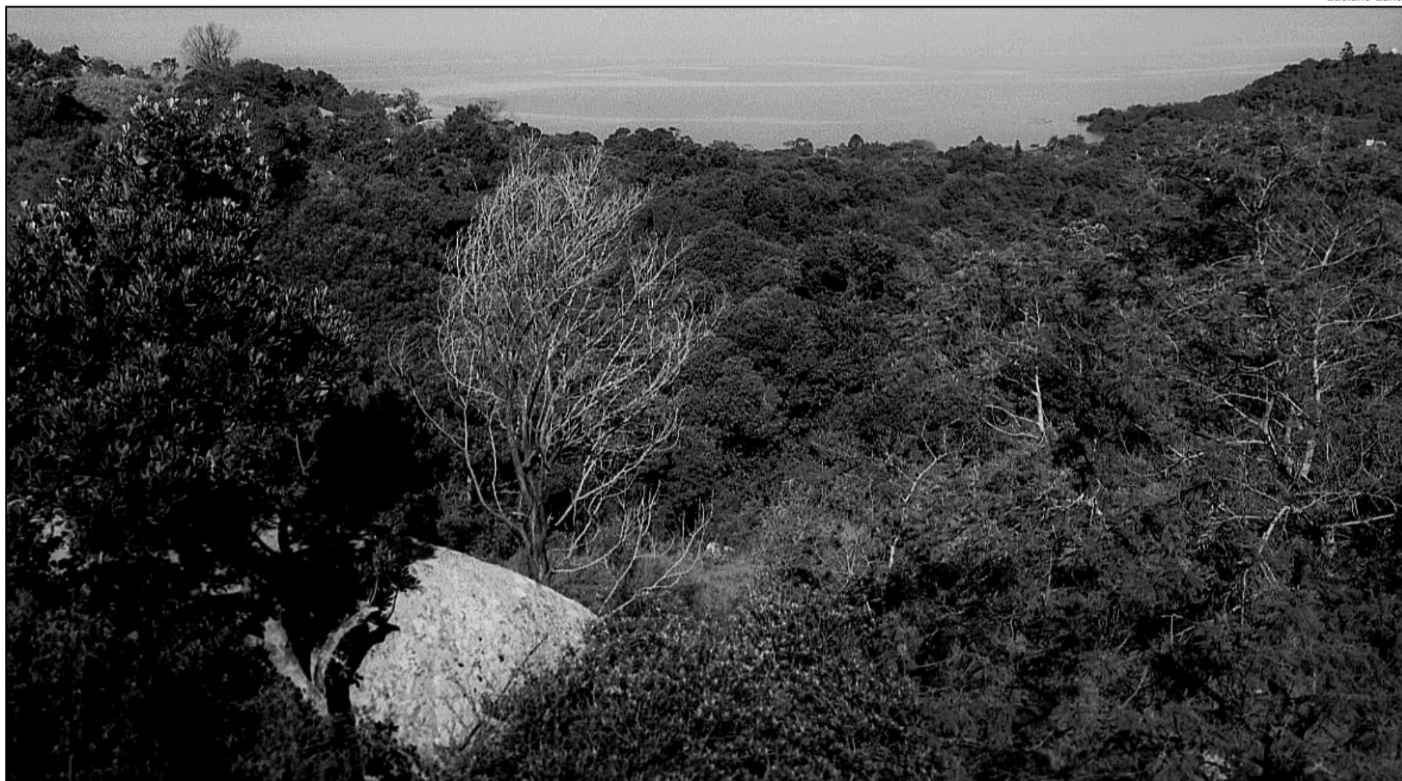
Vegetação do Morro do Osso (foto) é uma das mais suscetíveis ao fogo