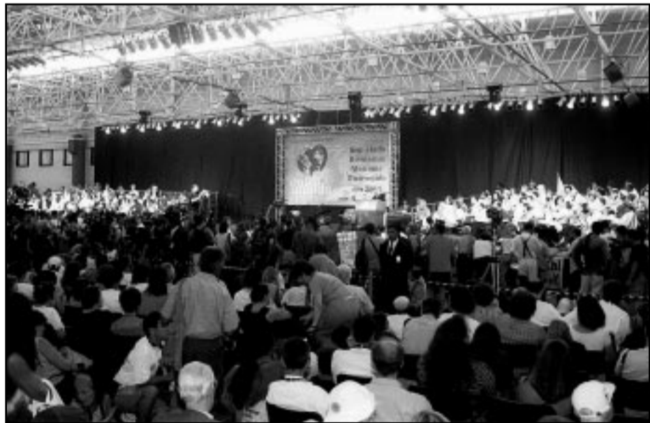
As três primeiras edições do evento se realizaram na capital gaúcha