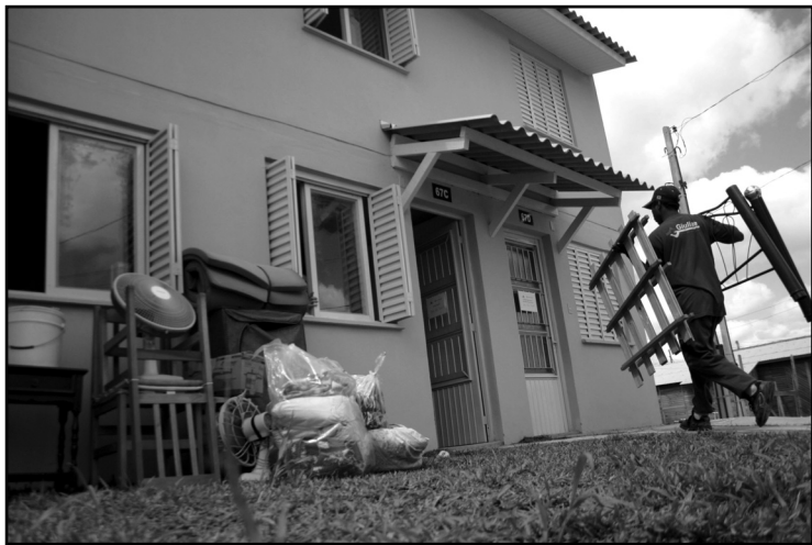
Até o momento, 353 famílias foram reassentadas