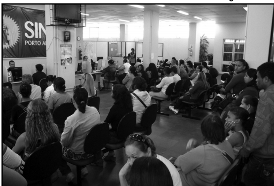
Sine Porto Alegre funciona na Mauá 1.013