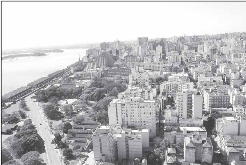
Membros do Comitê elogiaram a infra-estrutura da Capital e profissionalismo do trabalho apresentado