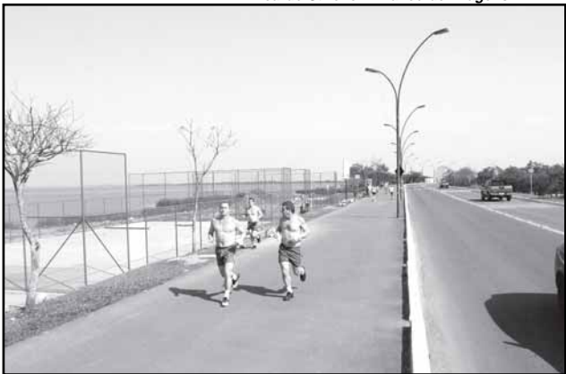
Quadras poliesportivas e nova iluminação na adoção Orla do Guaíba