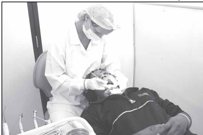
Consultório realizará atendimento de extração, obturação, limpeza, curativo de canal e outros procedimentos

Até o dia 15 de outubro — Exposição Água e Esgoto em Foco nos cinco postos de atendimento comercial do Dmae. Aberto ao público.