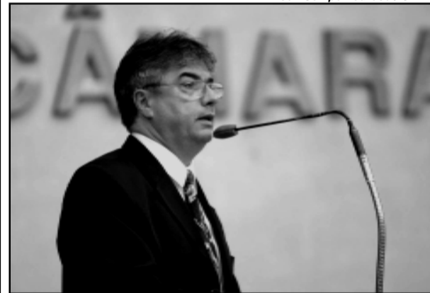
Antunes convidou para debate