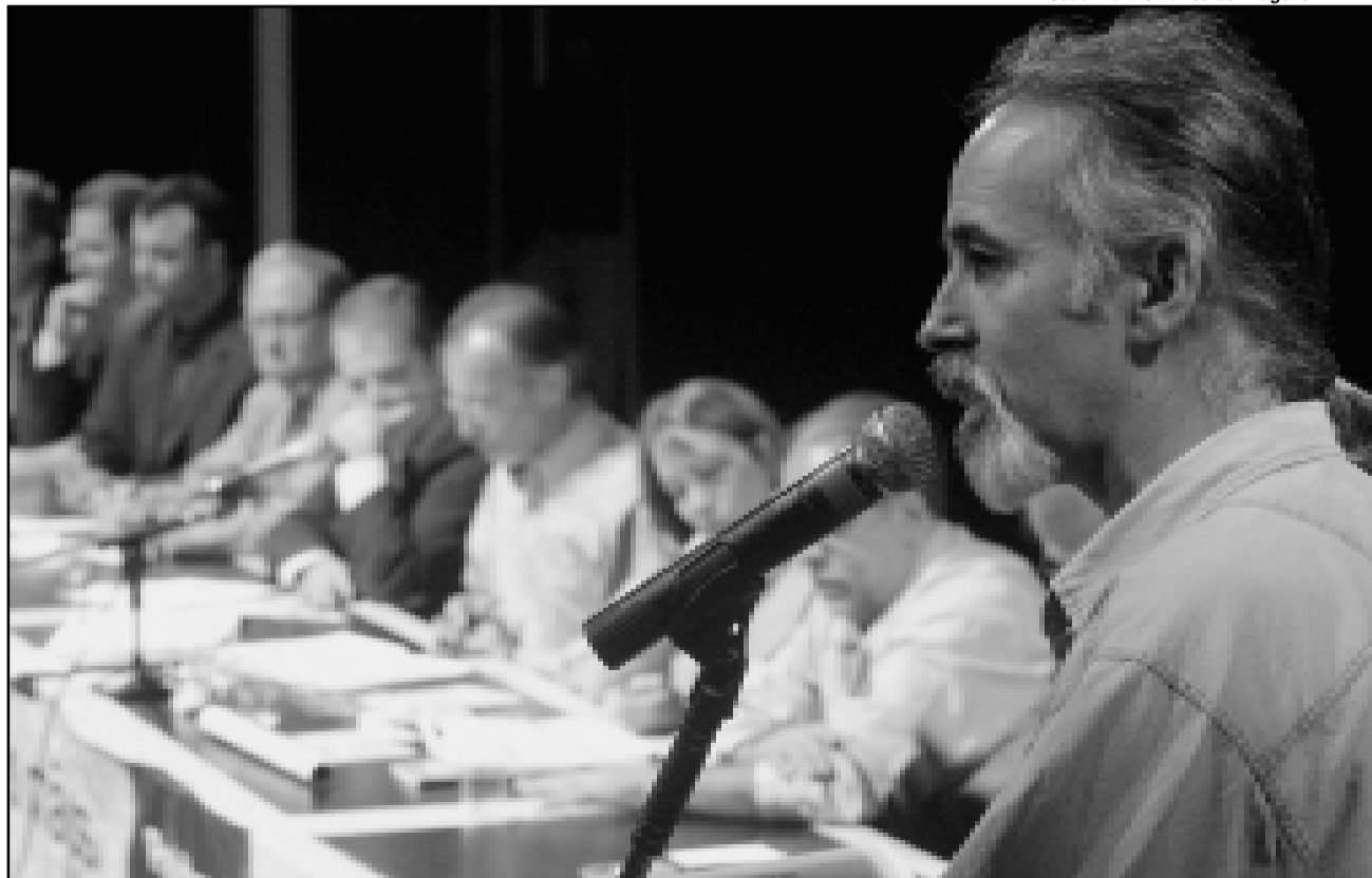
Plenária teve a participação de 389 inscritos

O ProJovem oferece avanço de escolaridade, qualificação profissional e desenvolvimento de atividades de responsabilidade social. Uma bolsa-auxílio de R$ 100 é concedida aos alunos que comprovarem frequência mínima de 75%. As áreas de ensino profissional oferecidas pelo programa são Vestuário, Construção e Reparos, Serviços Domésticos e Auxiliar Administrativo.