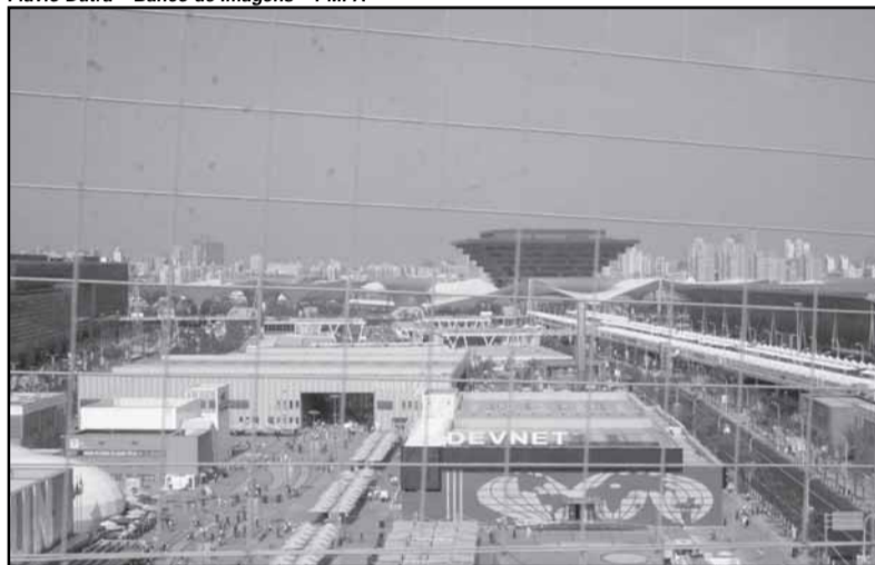
Vista geral da Expo 2010 considerada a maior exposição internacional de todos os tempos

X angai — Superou as expectativas da comitiva de Porto Alegre o primeiro dia de atividades na Expo Xangai 2010, a começar pela visita ao estande da capital gaúcha na área denominada “Melhores Práticas Urbanas”. Os visitantes ficaram entusiasmados com as soluções apresentadas no estande, concebido pelo designer Marcello Dantas, para expressar as ações de Governança Solidária Local, tema que levou Porto Alegre a ser uma das 55 cidades selecionadas para participar da Expo. O estande, com 206 m 2 , tem o formato de um labirinto circular, onde se projetam as ações Vela Social, Esporte dá Samba, Art&Mãe, ArteNorte e Vila Chocolate, todas resultados de parcerias de governança, que mobilizaram poder público, comunidades, instituições da sociedade e iniciativa privada.