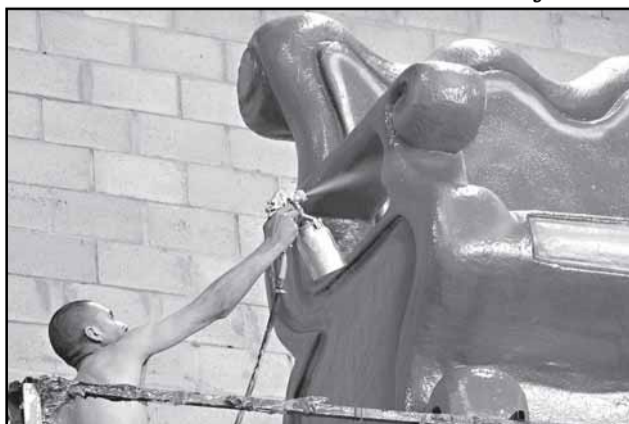
Escola se apresenta com 1.150 componente