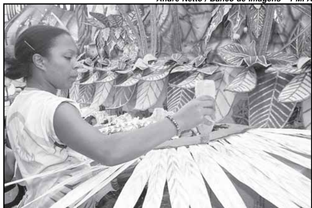
Vila do IAPI trouxe artesãos de Parintins