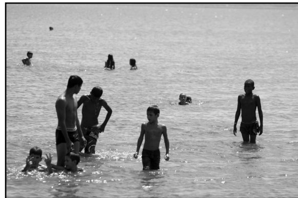
Aumento das algas resulta em pH mais alto e torna a água imprópria para o banho