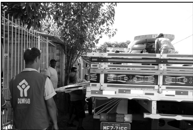
Desde 2010, foram retiradas 922 famílias de áreas com algum risco

acompanhamento, monitoramento e fiscalização urbano-ambiental (confira os locais no box abaixo). O Programa de Fiscalização e Monitoramento Urbano Ambiental da prefeitura contará com o apoio do Comando Ambiental da Brigada Militar.