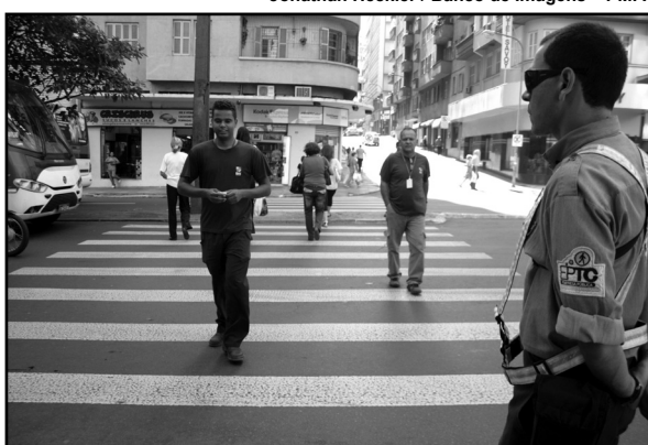
Dados foram computados entre os dias 1º e 31 de janeiro

Como próximas atividades de conscientização para um trânsito mais seguro, a EPTC projeta intensificar ações educativas em março, na volta às aulas, com a Semana contra a Violência no Trânsito. Também será reforçada a importância do respeito à travessia nas faixas de segurança, além de outras ações.