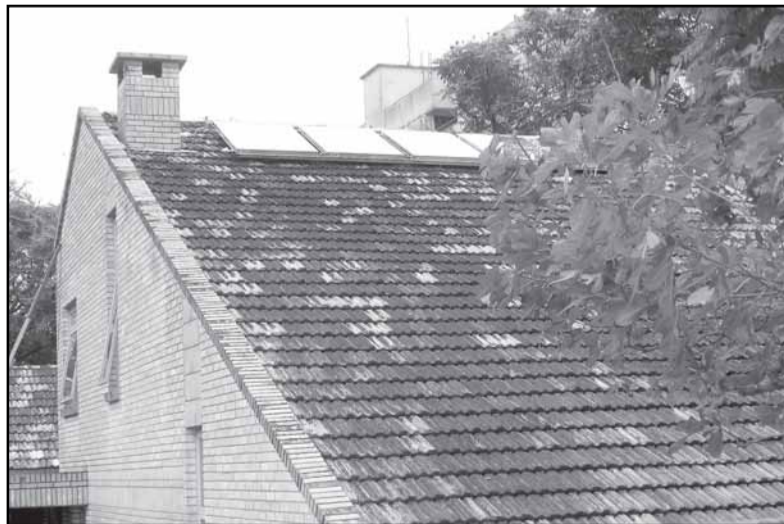
Dez painéis de energia solar aquecerão 600 litros de água

Um prédio público com água aquecida pelo sol. Essa ação inovadora da Secretaria Municipal do Meio Ambiente (Smam) terá solenidade de inauguração nesta quinta-feira, 10, integrando a programação da 26ª Semana do Meio Ambiente. O sistema de aquecimento solar está instalado na sede da Zonal