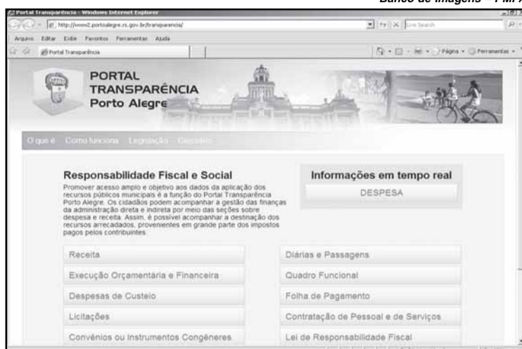
Portal tem atualizações diárias sobre receitas e despesas

No site www.portoalegre.rs.gov.br/transparencia é possível navegar pelas seções de receita, despesa, execução orçamentária e financeira, quadro funcional, folha de pagamento, diárias e passagens e contratações de pessoal. Na área da