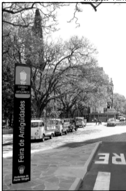
Caminho dos Antiquários: sábado, das 10h às 16h