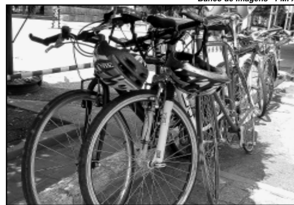
Serão recuperados três quilômetros