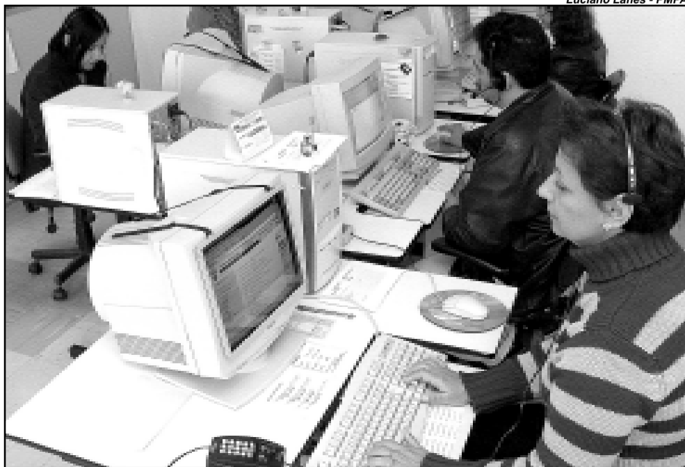
Novo sistema reduz o custo das ligações