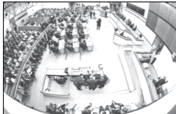
Plenário da CMPA

Textos elaborados e de responsabilidade da Assessoria de Comunicação da Câmara