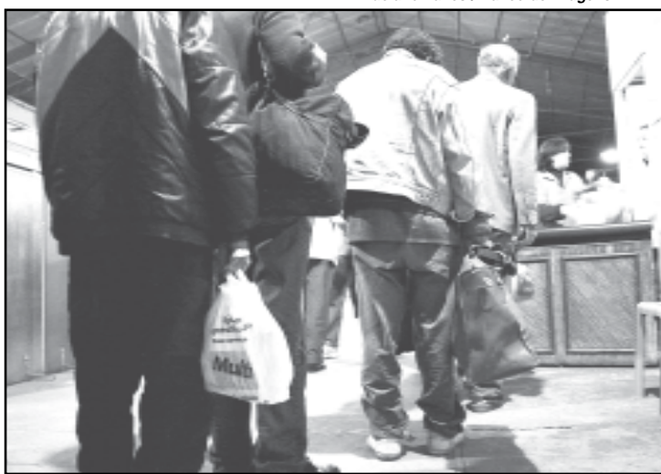
Operação Inverno começa domingo

Mais um serviço que pode ser acionado pela população é o Ação Rua, destinado ao atendimento de crianças e adolescentes em situação de rua. O programa funciona nos 11 cen-