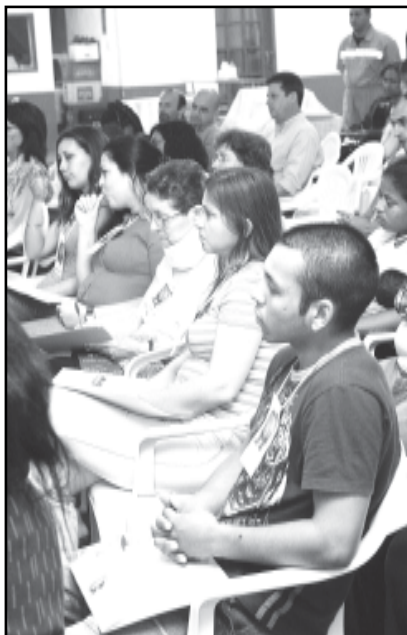
Com 72 alunos, curso ocorreu em outubro e novembro de 2007

Além da SMGL, a realização do curso conta com a parceria da Cruz Vermelha Brasileira, do Movimento Chega, Instituto de Mediação Clip, Programa pela Paz (Editora Paulina), secretarias municipais de Direitos Humanos e Segurança Urbana e da Educação, Coordenação de Defesa Civil e Brigada Militar. A Ilha da Pintada foi a primeira região onde o curso foi ministrado. Outras duas regiões estão inscritas: Norte e Leste.