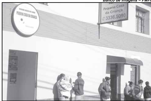
Além das reformas, Pequena Casa da Criança receberá equipe de PSF

Foram feitas a reforma da sala de curativos (troca do piso; instalação hidráulica, com pia e lavapés; azulejos e pintura); melhorias no escovódromo (pias e espelho, recuperação de alvenarias e piso); e criação de novo gabinete odontológico, com a instalação de duas cadeiras, troca do piso, recuperação das aberturas, instalações hidráulicas e pintura geral.