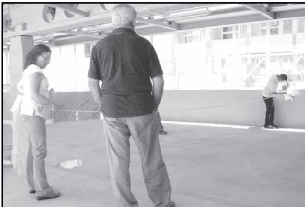
Agentes da Smov realizaram medições e avaliaram as modificações necessárias