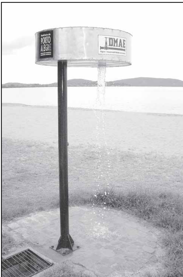
Smam e DMAE reformaram os chuveiros

Mais esclarecimentos podem ser obtidos junto ao Programa Guaíba Vive pelo telefone 3289-7515, ou e-mail guaibavive@smam.prefpoa.com.br