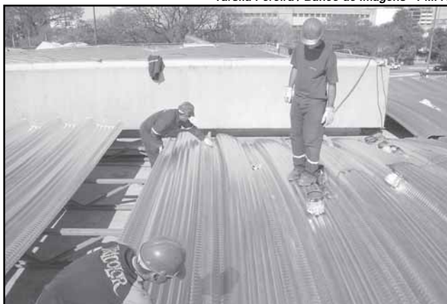
Telhado apresentava problemas estruturais desde a inauguração do prédio