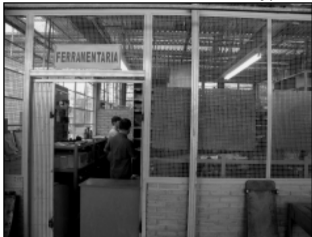
Foram criados espaços específicos para equipamentos e ferramentas

Na mesma cerimônia, a Carris entregará a chave do ônibus doado pela Receita Federal à Orquestra de Flautas da Escola Municipal de Ensino Fundamental Heitor Villa-Lobos. O veículo foi pintado e adaptado na oficina da companhia. A Orquestra fará duas apresentações na Carris: à tarde e também às 22h, para os mecânicos que trabalham no turno da noite.