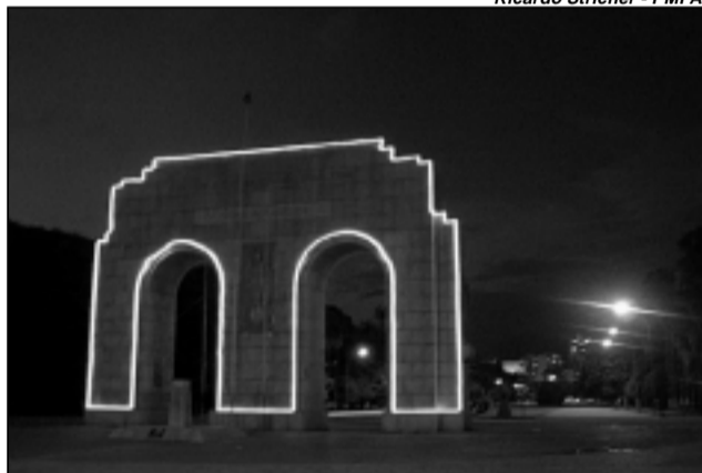
O Monumento ao Expedicionário havia recebido decoração especial para o Natal