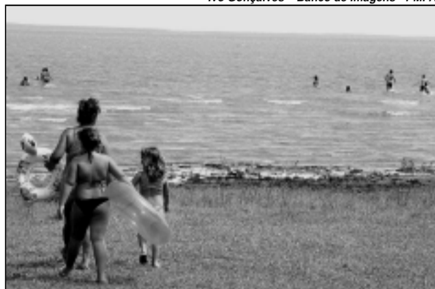
A orla do Guaíba está sendo preparada para o verão com ações de várias secretarias

A prefeitura de Porto Alegre está preparando a orla do Guaíba para o verão 2005/2006. Trata-se do projeto Porto Alegre Orla Verão 2005-2006 , cujo grupo de trabalho é coordenado pela Secretaria Municipal do Meio Ambiente (Smam)