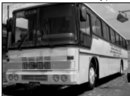
O ônibus que será utilizado pela Orquestra de Flautas foi adaptado na oficina da Carris