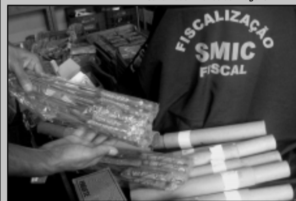
Em Porto Alegre, apenas dois estabelecimentos comerciais têm licença para vender fogos

Em Porto Alegre, apenas dois estabelecimentos comerciais têm licença para vender fogos: Bazar Bahia, em dois endereços - Avenida Presidente Roosevelt, 1383, e Rua Lopo Gonçalves, 111 - e Loterias Aymoré Ltda. - Avenida Presidente Roosevelt, 1444.