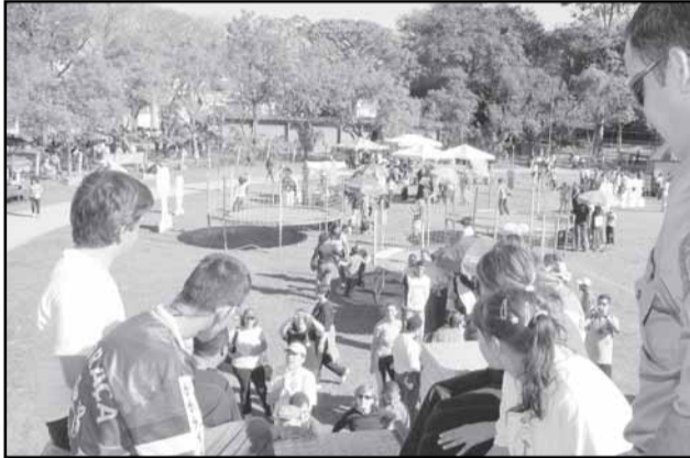
Semana da Pessoa com Deficiência contemplou atividades culturais, esportivas, de recreação e lazer e educativas