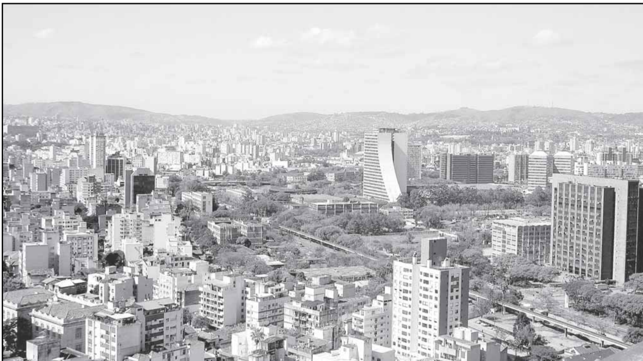
Todos os bairros da cidade já receberam as guias pelos Correios

Quem não aproveitar o desconto de 20% terá duas opções: 10% de desconto para os pagamentos efetuados até o dia 10 de fevereiro ou pagamento em 10 vezes sem desconto. A guia e o carnê com as duas opções serão enviados pelos Correios na segunda quinzena de janeiro. Em 2007, cerca de 50% das cerca de 500 mil guias de IPTU foram pagas até o dia 2 de janeiro.