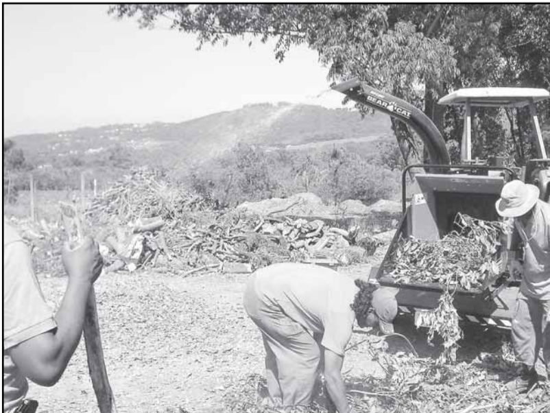
Restos de árvores serão transformados em composto orgânico