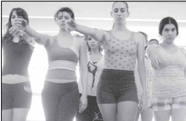
Laboratório de Expressão e Movimento do Grupo Experimental de Dança

O projeto do Grupo Experimental teve início em junho de 2007. O programa de aulas é diário, de segunda à sexta,