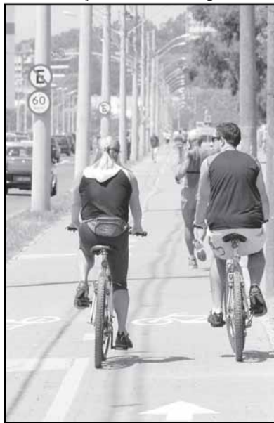
Ivo Gonçalves – Banco de Imagens – PMPA

Foram identificados 495 quilômetros propícios para ciclovias e ciclofaixas em diferentes regiões da cidade