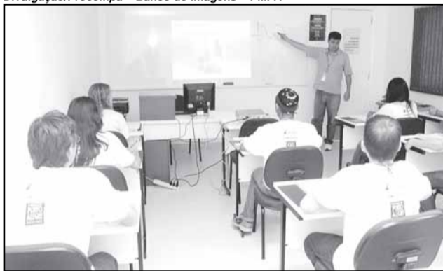
A maioria dos formandos já tem vaga de trabalho garantida