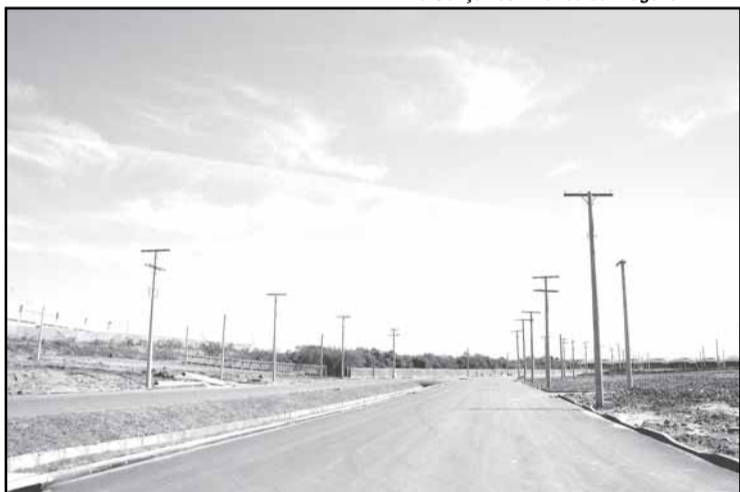
Casas serão construídas em área de 21 hectares próxima ao Porto Seco

Será instalado um galpão de triagem com mil metros quadrados, para materiais recicláveis. A reciclagem de materiais é fonte de renda e trabalho para cerca de metade dos moradores das vilas. Todas as vias serão asfaltadas. As casas terão 40 metros quadrados e dois dormitórios.