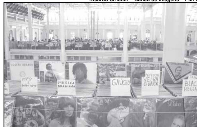
Feira do vinil: Dez expositores vão oferecer clássicos e raridades