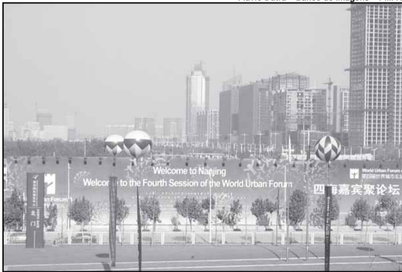
O 4º Fórum Urbano Mundial foi aberto ontem, na China, com a presença de mais de três mil delegados