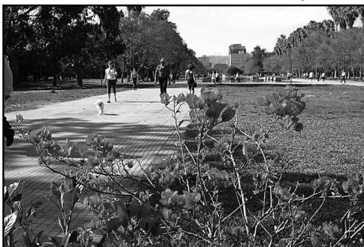
Caminhadas de verão em janeiro tiveram média de 200 participantes nos passeios