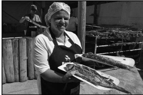
Luciano Lanes / PMPA

Expectativa é de que sejam comercializadas 230 toneladas