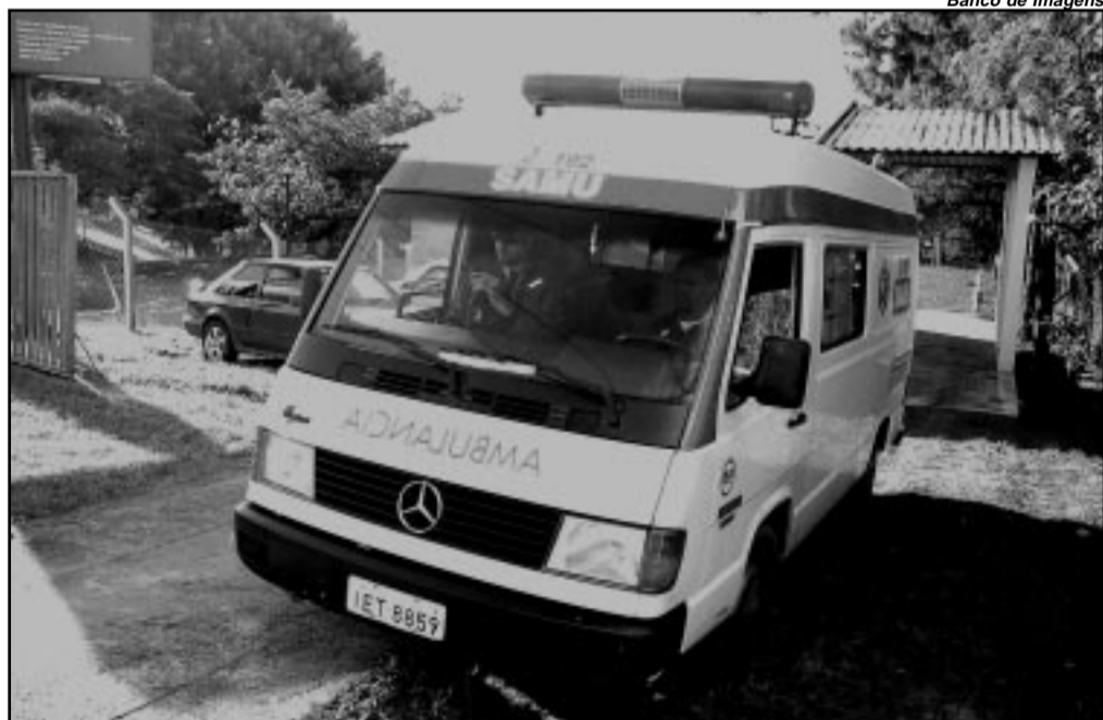
Ambulâncias do serviço ganham identificação visual com novas cores