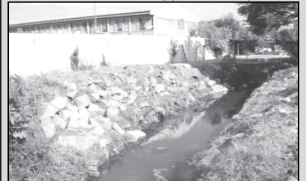
O trabalho debate com alunos os ciclos natural e urbano da água