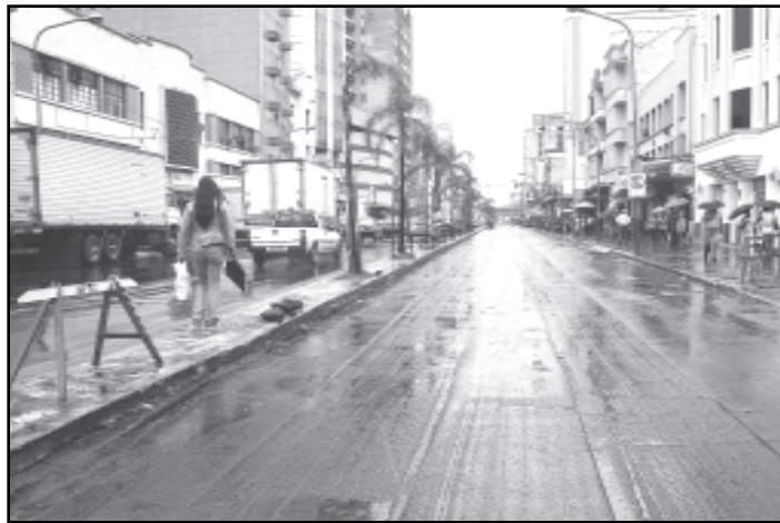
Serão recuperados de 580 metros da via

A Secretaria Municipal de Obras e Viação (Smov) encerrou ontem a fresagem (raspagem do asfalto atual) da Avenida Júlio de Castilhos. Nos próximos dias, a Smov dará continuidade aos trabalhos, com as obras de revitalização asfáltica. Serão recuperados de 580 metros da via, no trecho entre o Largo Visconde de Cairu e Rua da Conceição. Também no Centro, as ruas Coronel Vicente, Chaves Barcelos e Carlos Chagas, além do Largo Visconde de Cairu, serão os próximos locais a serem revitalizados. Em decorrência das obras o tráfego sofre alterações controladas pela Empresa Pública de Transporte e Circulação (EPTC).