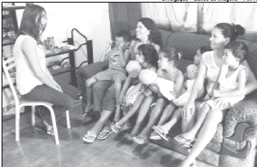
As visitas são focadas no fortalecimento do vínculo entre mãe e filho