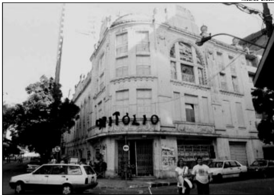
Prédio será transformado em centro cultural e abrigará uma cinemateca