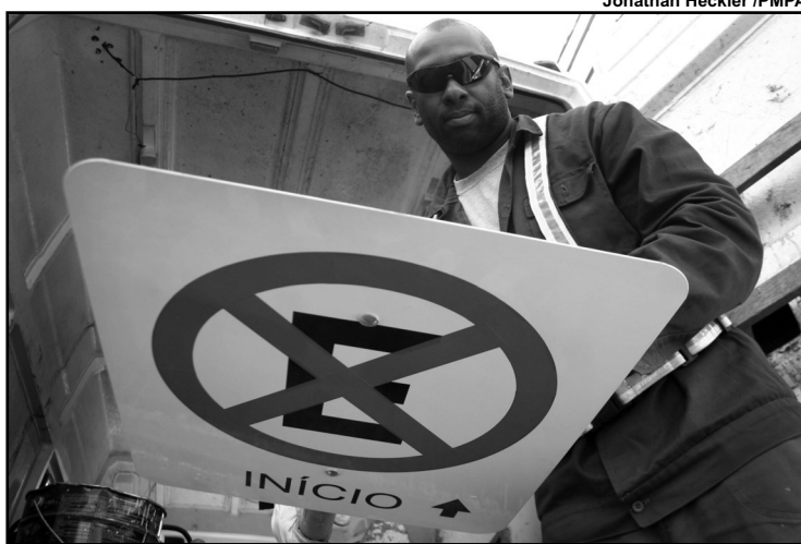
Obras serão feitas a partir de outubro

A rua Sarmento Leite será alargada no trecho entre a rua Irmão José Otão e a saída do túnel, com implantação de sinaleiras. Será aberta uma nova via, ligando a Rodoviária à avenida Voluntários da Pátria, junto ao cruzamento com a Barros Cassal. O transporte coletivo não sofrerá mudanças no interior do túnel.