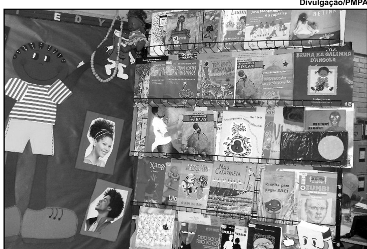
Escolas municipais farão atividades sobre o tema

Desde o ano passado, a Semana da Consciência Negra tornou-se uma atividade unificada. “É um evento de Porto Alegre, que engloba a pluralidade de movimentos sociais da cidade, tendo como principal objetivo a luta contra a discriminação étnica, social, além da reflexão sobre o negro na atualidade”, destaca o coordenador do GPN.