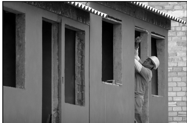
Áreas selecionadas vão abrigar 3,5 mil famílias