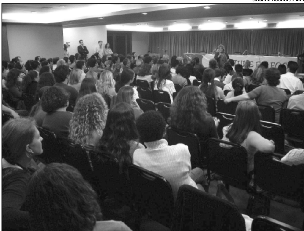
Drogas: é preciso colocar em prática um programa de prevenção desde a infância e tratamento aos jovens usuários

Drogas lícitas — Pesquisa realizada nos municípios com mais de 200 mil habitantes, coloca o Brasil no sexto lugar entre os maiores consumidores de drogas lícitas (álcool e tabaco), com 19,4%. Os Estados Unidos é o primeiro da lista, com um total de 38,9% dos