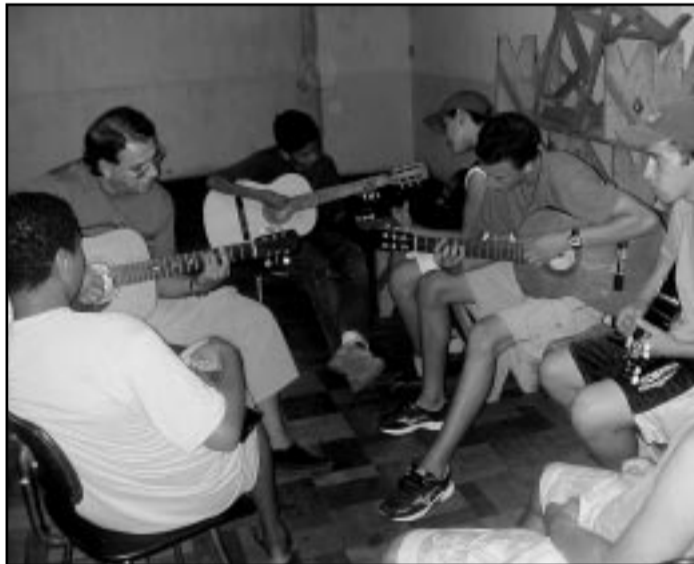
Música é uma das alternativas oferecidas nas oficinas

Desenvolvida pela Secretaria Municipal de Cultura (SMC), a Descentralização da Cultura nasceu como um projeto inovador da Prefeitura que busca levar cultura a toda a cidade. O projeto tornou-se uma coordenação da SMC e hoje, em conjunto com as demais coordenações da área, incentiva o desenvolvimento autônomo dos moradores das comunidades envolvidas por meio de atividades culturais. Associações, escolas, creches, CTGs, praças, parques e diversos locais tornam-se referências como