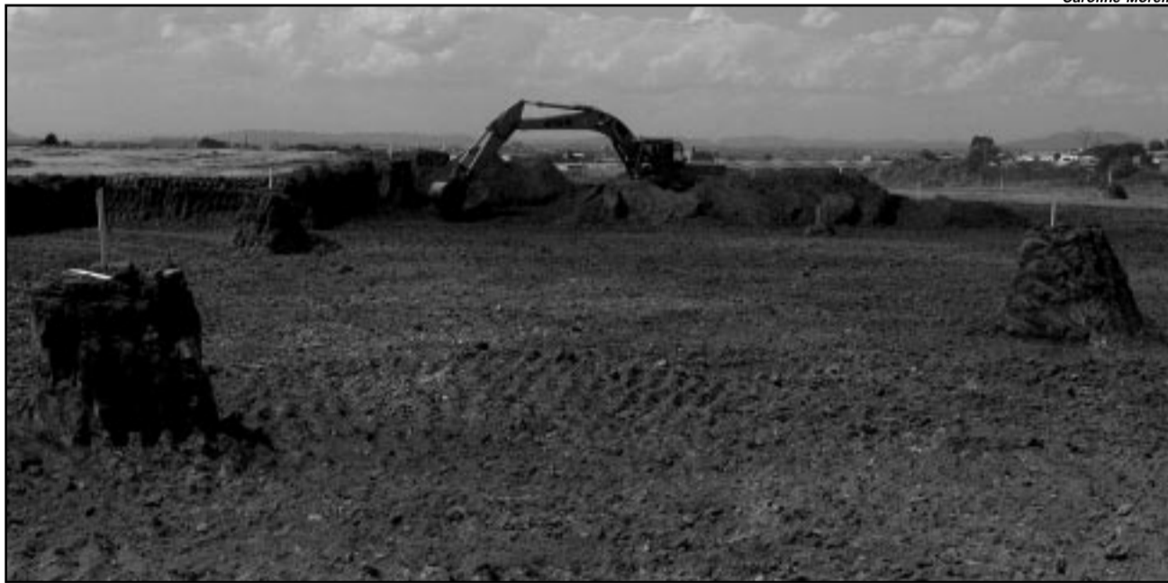
Cerca de 50 máquinas são operadas na área, localizada na região do Porto Seco