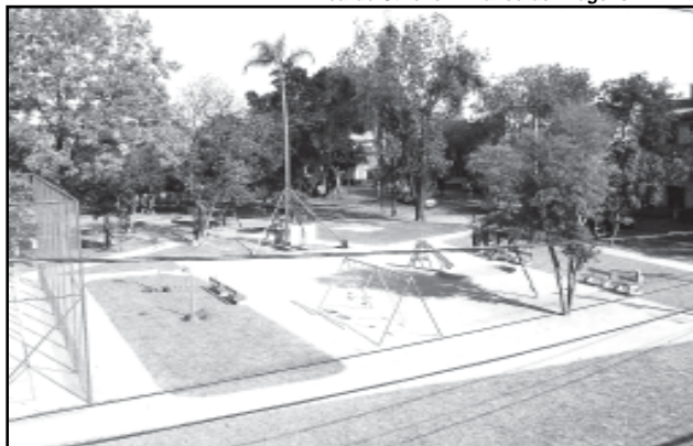
As melhorias viáveis nas praças e parques são discutidas com a comunidade