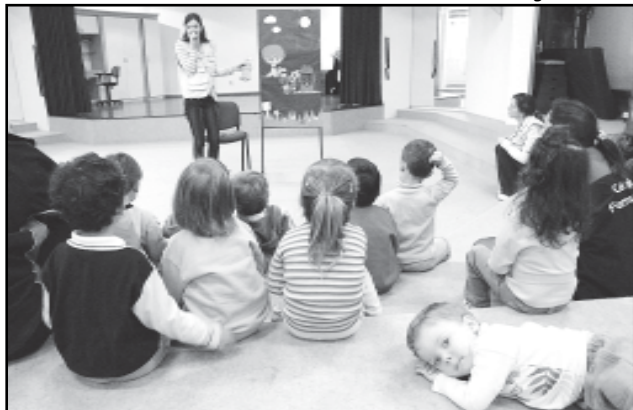
Educação ambiental é acessível a todas as idades