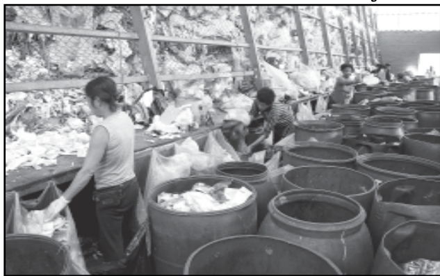
Nas 14 Unidades de Triagem conveniadas com o DMLU trabalham cerca de 700 pessoas