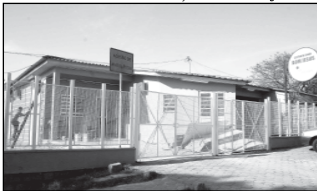
O Centro tem pronto-atendimento, ambulatório de especialidades, coleta ambulatorial, radiologia, ecografia, farmácia distrital e a Unidade Básica de Saúde