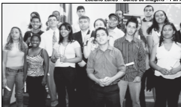
Trabalho para a Juventude já formou mais de 2 mil jovens

Podem se candidatar às vagas jovens entre 16 e 29 anos, residentes em Porto Alegre e sem emprego com carteira assinada. As próximas inscrições ocorrem em 2008. Para concorrer a vagas dos cursos de qualificação, os jovens podem procurar o Sine Municipal (Avenida Mauá, 1013, no Centro), ou fazer sua inscrição pela Internet, no site www.trabalhoparaajuventude.com.br . nas datas de inscrição divulgadas na imprensa.