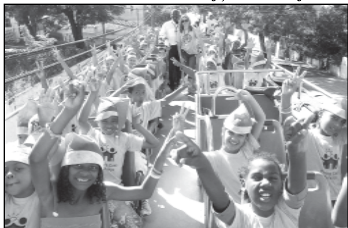
Linha Turismo foi palco para a festa de meninos e meninas da Pequena Casa da Criança