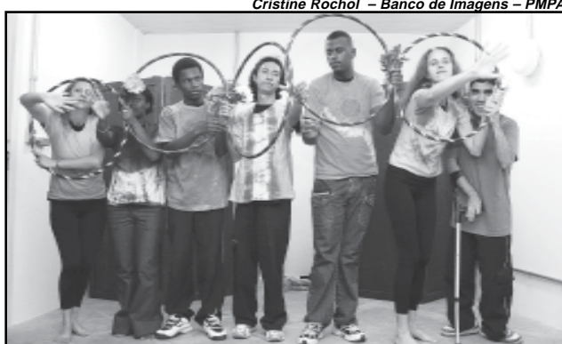
Apresentação teatral de uma turma de surdos foi uma das atrações da solenidade

Com 80 horas/aula em dois turnos, os cursos profissionalizantes exigem dos participantes uma frequência mínima para certificação de 75% da carga horária. Em 2007, foram realizados quatro períodos de cursos: de 27 de agosto a